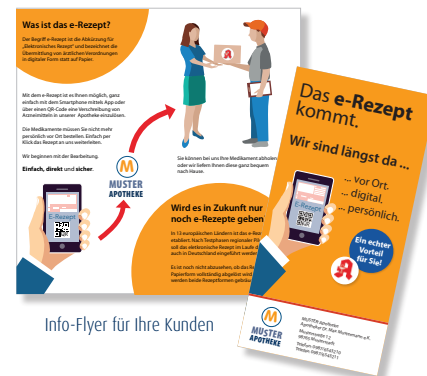
Info-Flyer für Ihre Kunden

Format DIN lang (99 x 210 mm) 4-farbig, 170g Papier